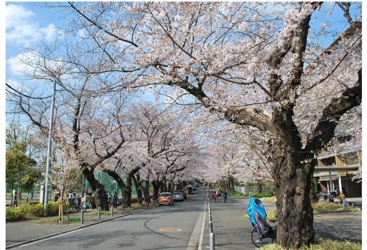
hocco 付近の桜並木の様子（2021年4月撮影）

hocco は、明治期から桜の名所として親しまれてきたエリアに、地域コミュニティとモビリティ拠点を目指して昨年10月に開業した施設であり、物販など「なりわい」を営める店舗併用住宅等で構成します。本イベントは、桜並木をより多くの方にお楽しみいただきたい想いととも、hocco へご入居いただく皆さまと協働して地域の賑わい創出に取り組むものです。