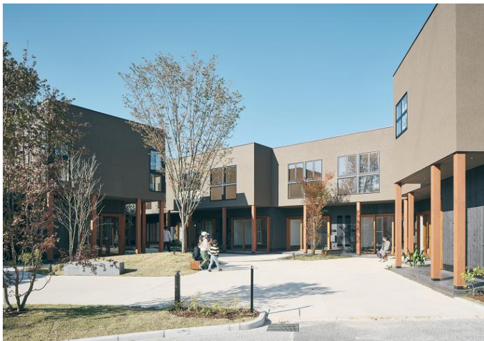
現在の hocco の様子

小田急バス株式会社（本社：東京都調布市 社長：早川 弘之）は、2022年4月2日（土）に武蔵野市桜堤の複合施設「hocco（ホッコ）」にて、開業後初となるイベント「桜堤おてせいなりわい市」を開催します。また、3月18日（金）からは、同施設でお買い物をお楽しみいただいた方へ、当社の武蔵境駅北口発着の路線バスで1回ご利用いただけるデジタルチケット「バス無料チケット（hocco）」を発行する新サービスを開始します。