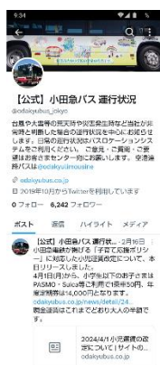
【画像6】X（旧 Twitter）による情報提供