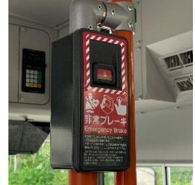
【画像3】異常時対応システム（EDSS）

沿線の警察署や小学校、地域団体とタイアップした「交通安全教室」も開催し、道路利用者の一員として、バスだけでなく歩行者や自転車にも安全意識を持っていただく取り組みを通じて、交通事故撲滅の一翼を担ってまいります。