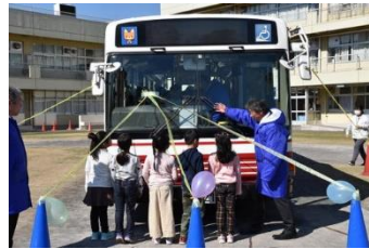
【画像4】小学校で開催の交通安全教室 (死角について)

沿線の警察署や小学校、地域団体とタイアップした「交通安全教室」も開催し、道路利用者の一員として、バスだけでなく歩行者や自転車にも安全意識を持っていただく取り組みを通じて、交通事故撲滅の一翼を担ってまいります。